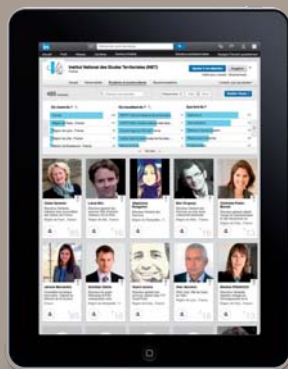
LA COMMUNAUTÉ INET SUR LINKEDIN