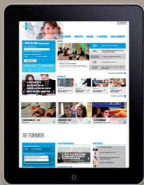
LE SITE INTERNET DE L'INET