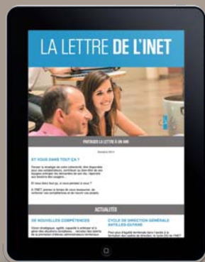
LA LETTRE DE L'INET