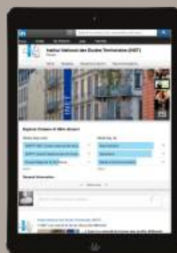
LA COMMUNAUTÉ INET SUR LINKEDIN