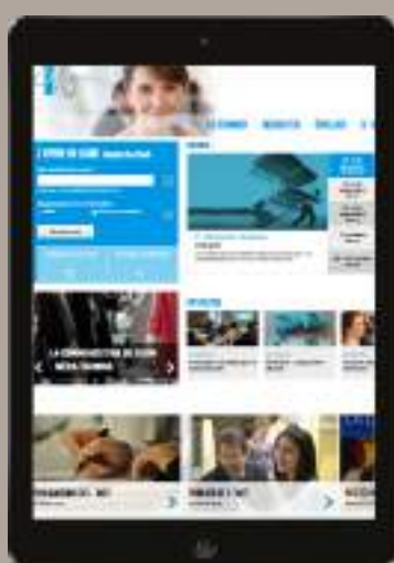
LE SITE INTERNET DE L'INET