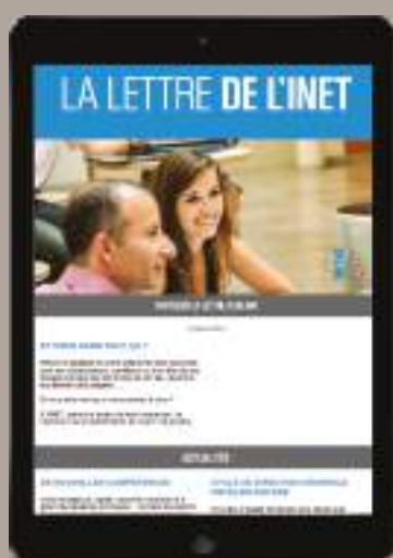
LA LETTRE DE L'INET