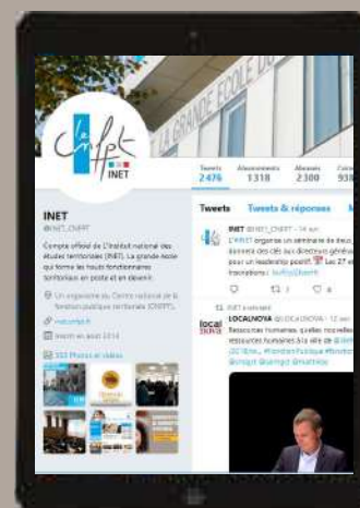
LA COMMUNAUTÉ INET SUR LINKEDIN, TWITTER ET FACEBOOK