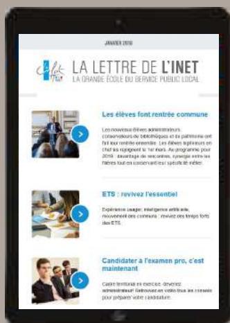
LA LETTRE DE L'INET