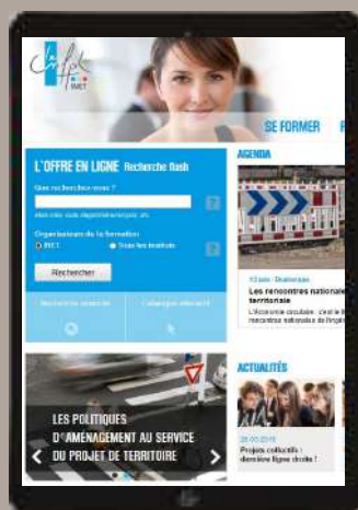
LE SITE INTERNET DE L'INET