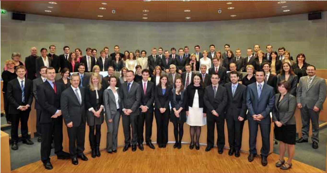
Promotion Robert Schuman