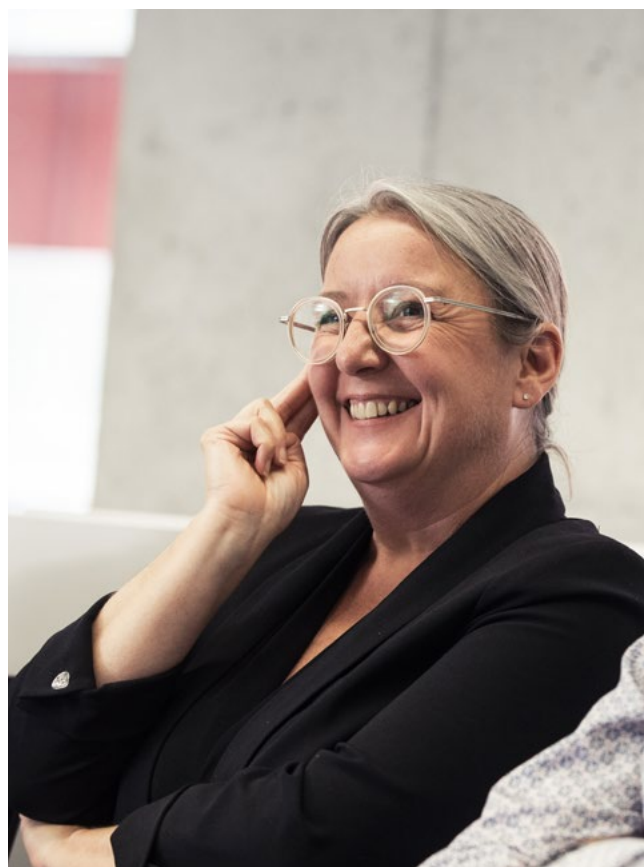
Stagiaires du CSM, en formation à l'INET

Les épreuves universitaires de Master se dérouleront tout au long de la formation et le mémoire sera soutenu en fin de cursus.