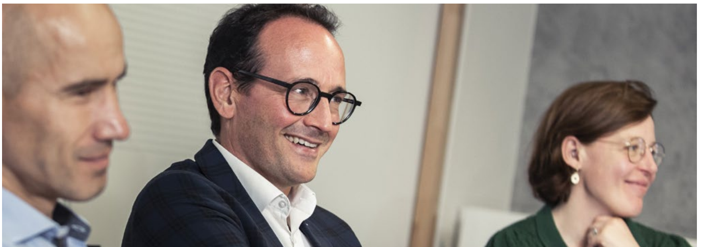
Stagiaires du Cycle Supérieur de Management, en formation à l'INET

Ce cycle propose à l'ensemble de ses stagiaires un dispositif d'accompagnement individualisé et personnalisé dans leur développement professionnel et les nouvelles perspectives qui s'offrent à eux.