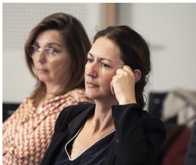
Stagiaires du CSM, en formation à l'INET

La restitution faite auprès de la collectivité commanditaire constitue le retour terrain et le mémoire (issu d'une problématisation et d'une analyse) constitue le retour académique.