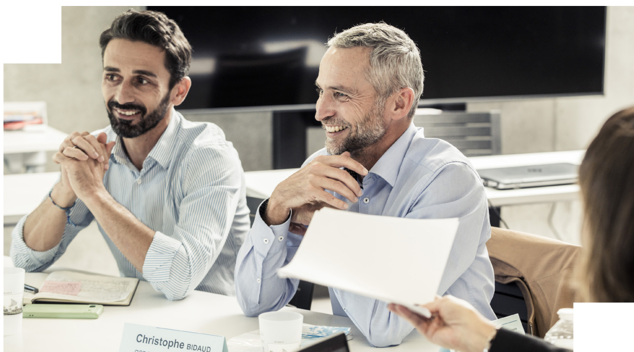
Stagiaires du cycle de direction générale

Les frais spécifiques engendrés par le voyage d'étude sont directement pris en charge par l'INET.