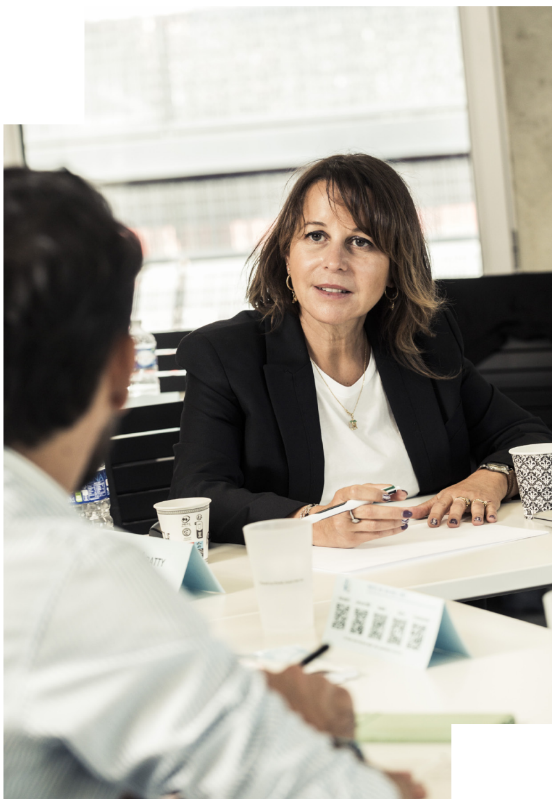
Stagiaires du cycle de direction générale

La destination du voyage d'étude est définie en amont par l'INET selon des finalités pédagogiques du cycle.