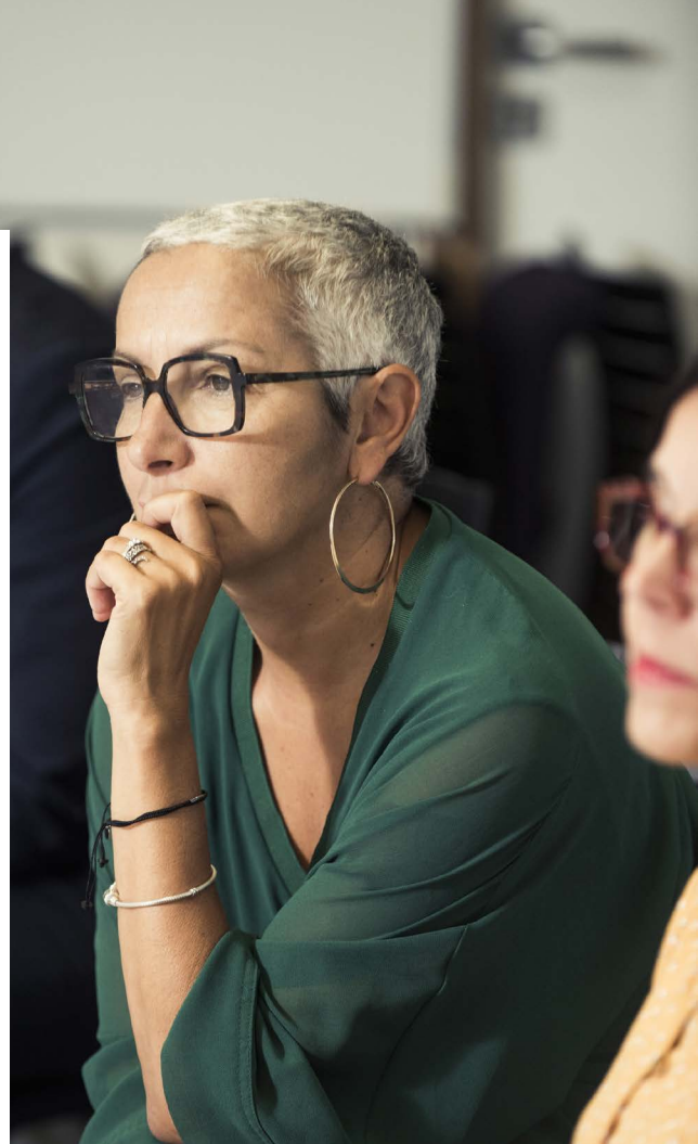
Stagiaires du CSM, en formation à l'INET

Ce temps spécifique permet de développer l'intelligence collective, la prise de recul, la réflexion et l'action.