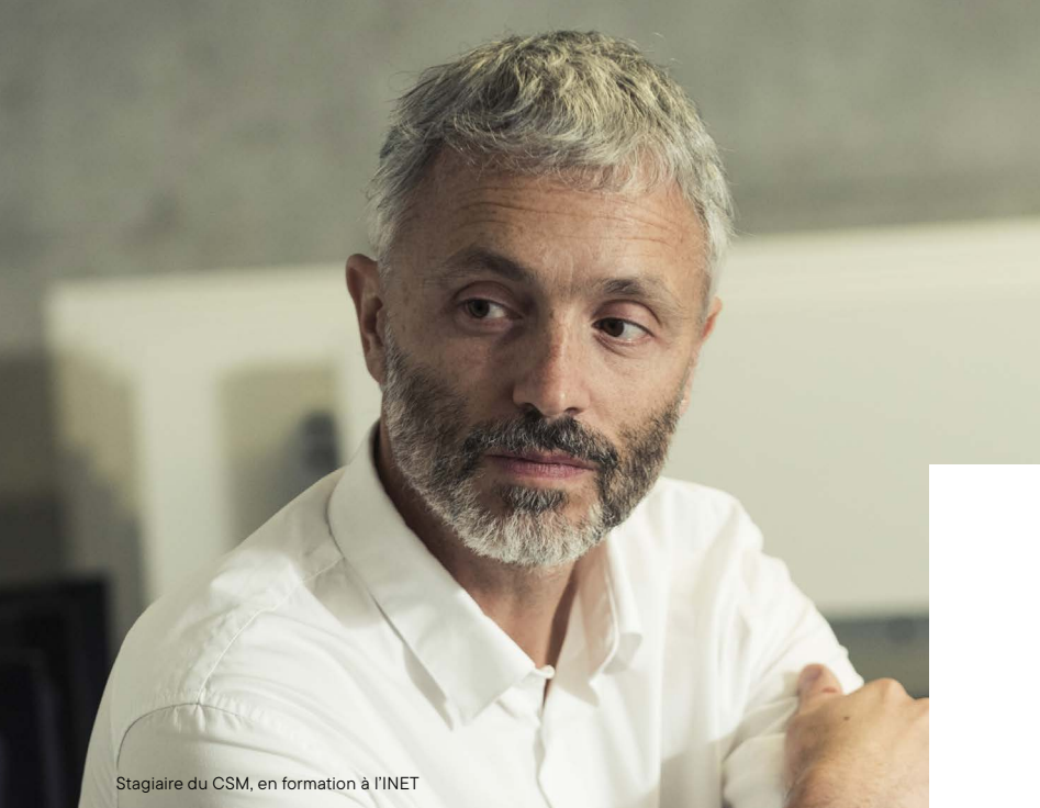
Stagiaire du CSM, en formation à l'INET