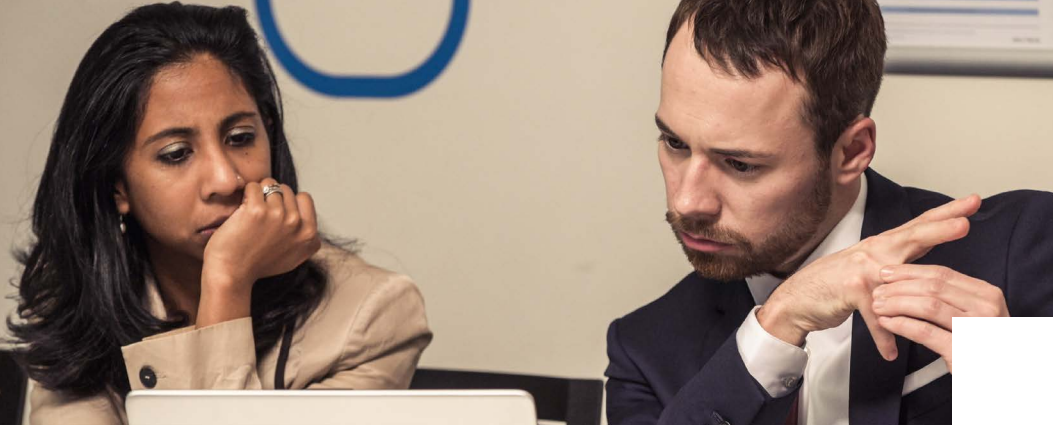
Élèves en formation à l'INET