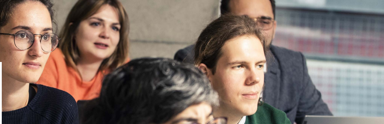
Élèves en formation à l'INET

Le modèle de formation de l'INET repose sur des périodes de mises en situation professionnelle qui permettent aux élèves de monter progressivement en compétences et en responsabilités. Au cours de leur scolarité, ils effectuent 3 à 5 stages en collectivité.