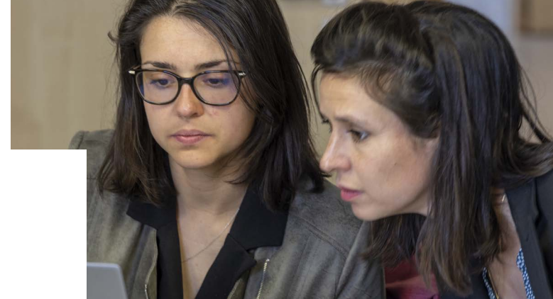
Élèves en formation à l'INET

Une participation forfaitaire de 4 000 € est demandée pour contribuer à la couverture des frais de réalisation des projets collectifs (accompagnement méthodologique des élèves, frais de déplacement, etc.).