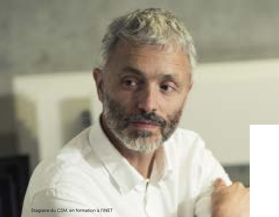
Stagiaire du CSM, en formation à l'INET