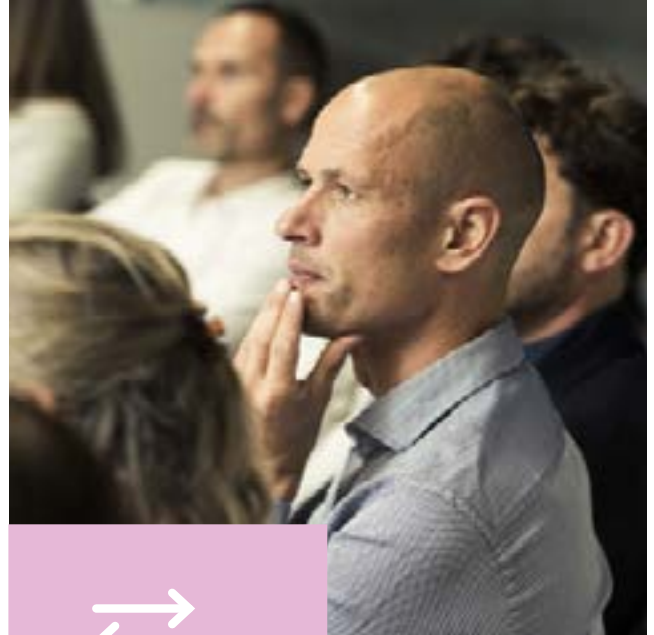
Stagiaires du CSM, en formation à l'INET

L'ensemble du Cycle Supérieur de Management repose sur une pédagogie spiralaire : à la fois active, progressive, diversifiée, concrète et experte.