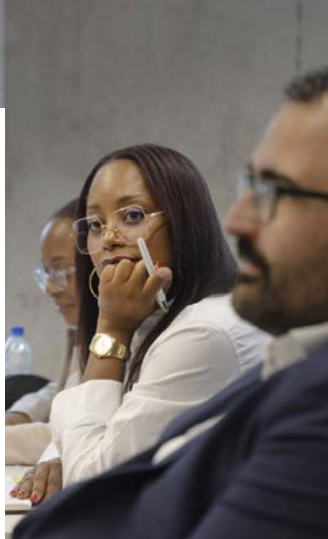
Stagiaires du CSM, en formation à l'INET

Ce temps spécifique permet de développer l'intelligence collective, la prise de recul, la réflexion et l'action.