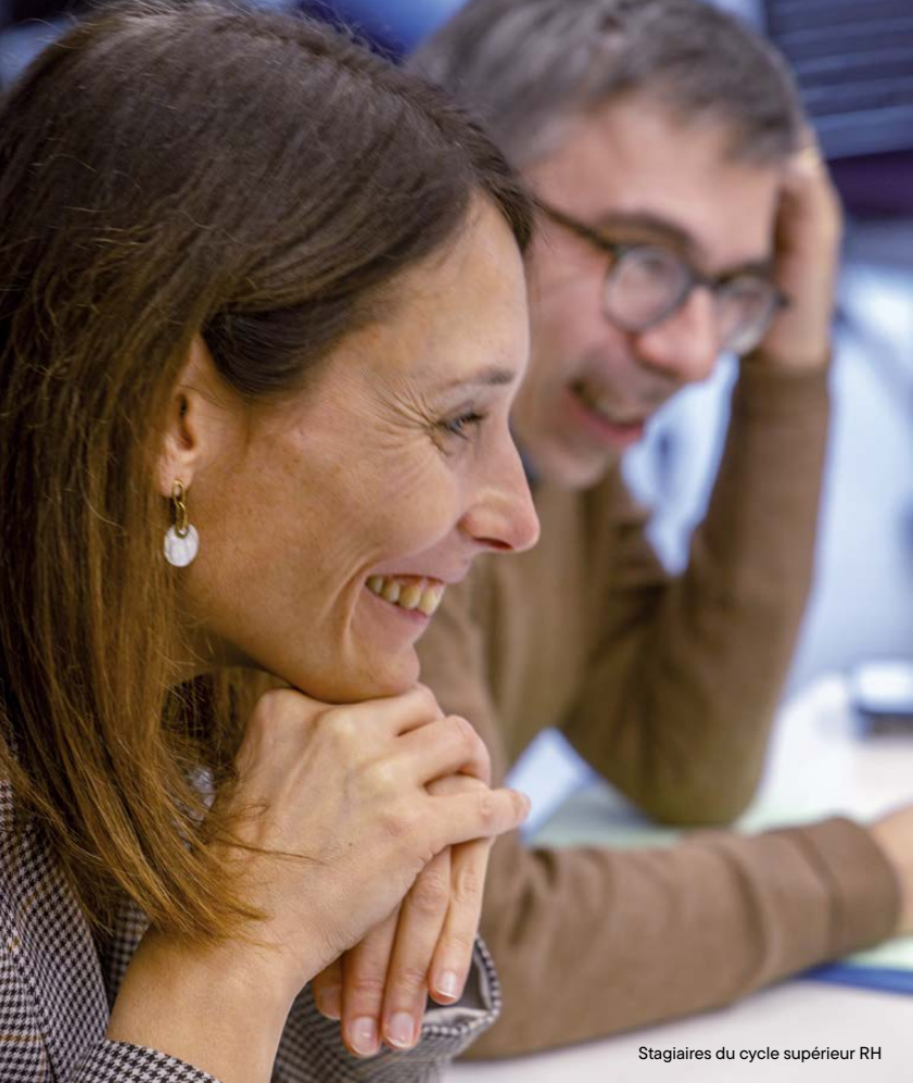
Stagiaires du cycle supérieur RH

« Le rythme mensuel du cycle favorise l'intégration progressive des apports, permettant aux cadres de les expérimenter concrètement dans leur environnement professionnel entre chaque session. »