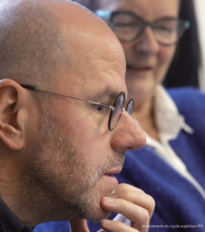
Intervenants du cycle supérieur RH