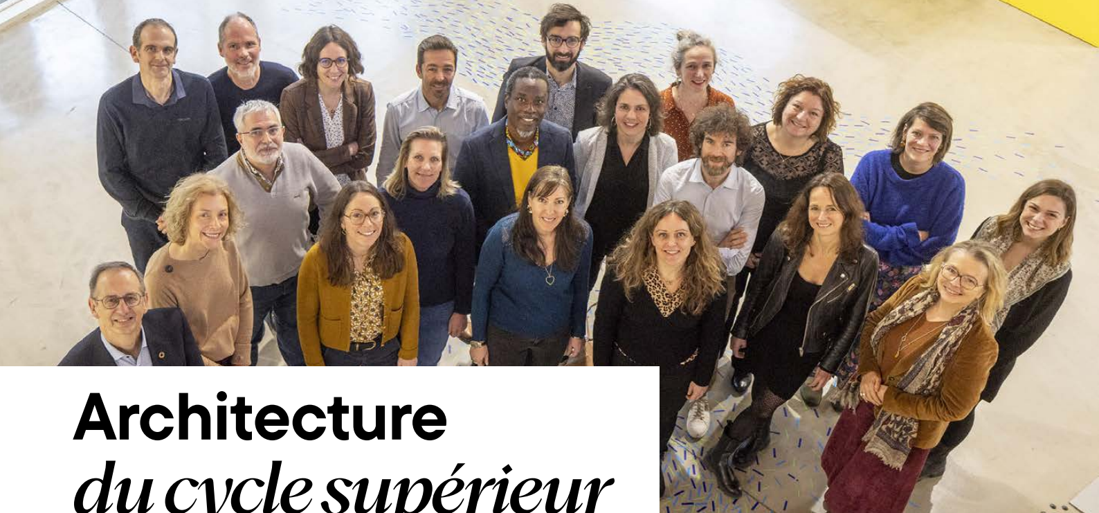
Stagiaires de la 5e promotion du cycle CST