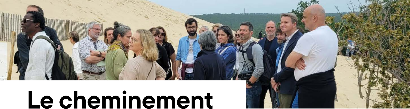
Stagiaires du cycle CST