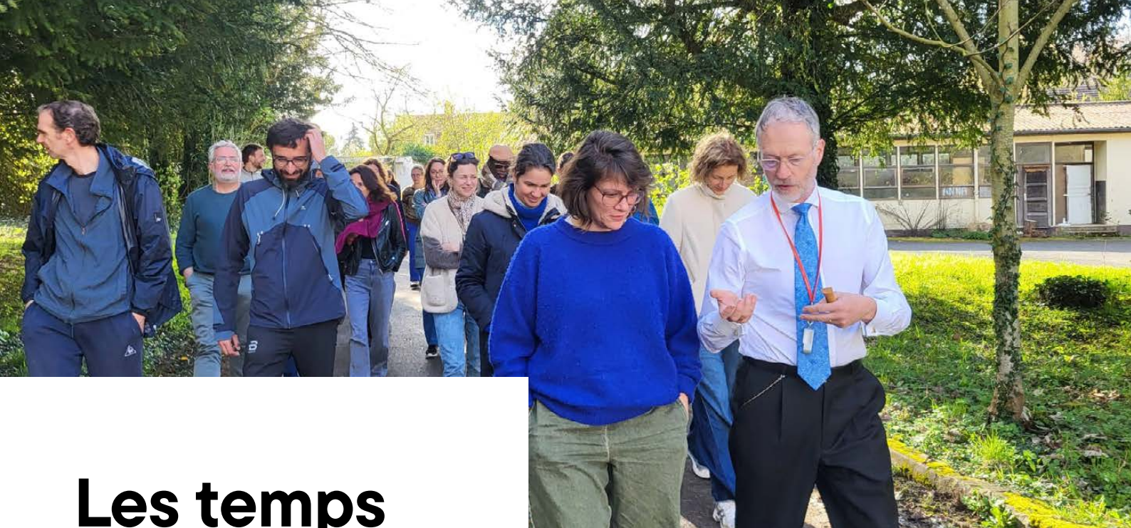
Campus de la Transition