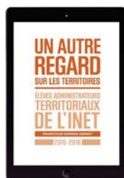
Publications de l'INET