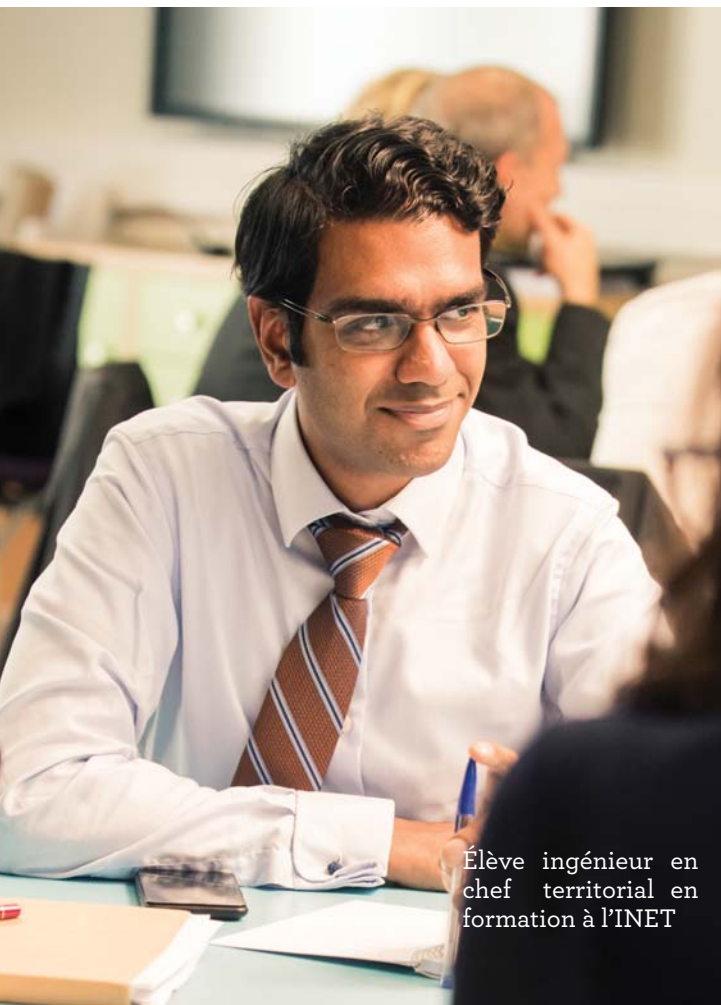
Élève ingénieur en chef territorial en formation à l'INET

Il est aussi possible de devenir ingénieur en chef par le biais d' un examen professionnel .