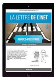
Lettre de l'INET