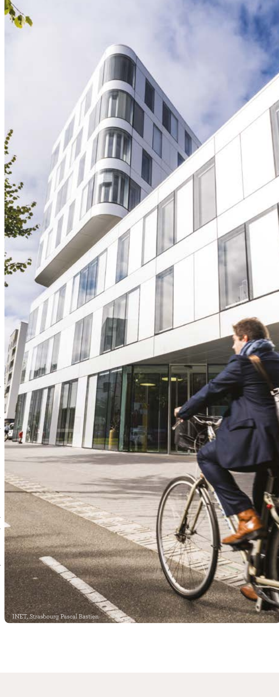
ARCHITECTES : Richard Durr, Archimède (MA), Morlaix, Amand Leclercq et Colette (AZO) Associés, Perspectives, Au Buffalo, Chantal Pellon

Un projet professionnel, ça se prépare, ça se mûrit, ça se partage, ça évolue au fil des rencontres, des opportunités, des incidents de parcours ou des alternances politiques. Analyser son potentiel, anticiper les opportunités ou les risques, prendre le temps de définir sa trajectoire professionnelle et son plan de formation, c'est essentiel pour évoluer sereinement, même en périodes troublées. Mieux vaut être accompagné par des professionnels pour définir son projet et se poser les questions qui font avancer.